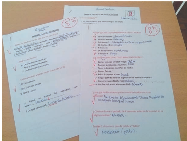
[Figura 3] MUESTRA DE EXÁMENES