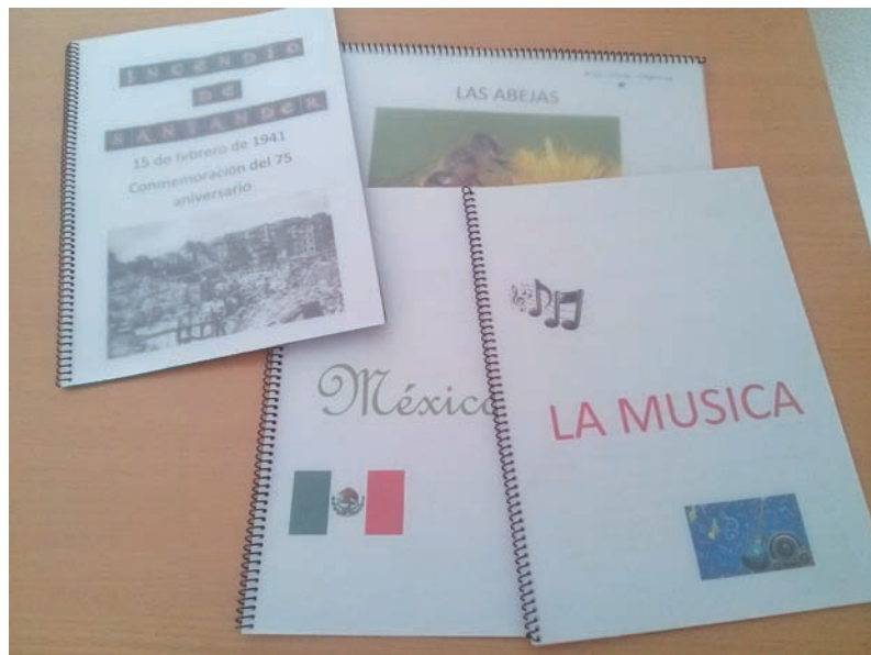
[Figura 2] MUESTRA DE LIBRETAS ENCUADERNADAS