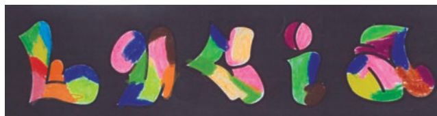
[Figura 4] CREACIÓN DE UN GRAFITI