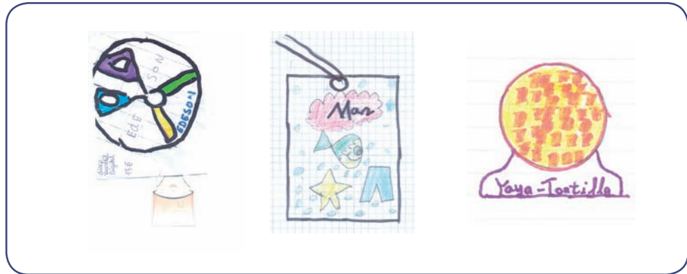
[Figura 5] EJEMPLOS DE LOGOTIPOS

Érase una vez un chico con Síndrome De Down que se le incendió la casa y echaba muchísimo humo. El chico vio las llamas en la cocina e intentó apagar el fuego con cubos de agua. Pero como no pudo apagarlo llamó a los bomberos y vinieron con las mangueras a apagar el incendio. Como había mucho viento se traspasó el fuego a otro edificio. El chico, asustado, salió a la calle corriendo. Las ventanas de su casa se rompieron todas y su edificio se cayó al suelo. El chico se sintió mal porque no tenía casa ni tele, tablet, sin móvil ni nada. Los cables de la luz de su casa también se habían caído y empezaron a lanzar chispas. Todos los vecinos ayudaron a ese chico que tenía Síndrome de Down a construir una casa nueva.